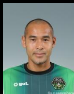
SC相模原 高原直泰 (元日本代表)