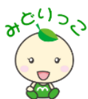
みなみもと看護師