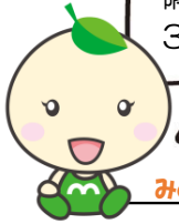
みどりっこちゃん

みどりっこには、プレイルーム、隔離室2室(内1つは陰圧室)の3つのお部屋があるよ。